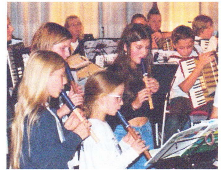
Das Flötenensemble Maisacher Würfel.

AM SAMSTAG, DEN 21. 10. 2023, spielten die Kinder- und Jugendensembles Tiger I, II, III sowie das Flöten- und Percussionensemble des Akkordeonorchesters Maisacher Würfel mit Unterstützung des Orchesters I sowie den Schwabinger Akk-Key-Kids der Städtischen Sing- und Musikschule München ein buntes, cooles und fetziges Programm mit