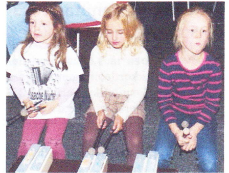
Teilnehmende Musikerinnen des Kino-Rettungskonzertes in Fürstenfeldbruck.