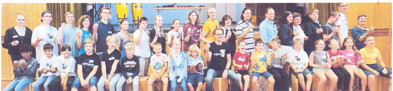
Gruppenfoto der Teilnehmenden des Akkordeonjugendtages des Deutschen Harmonika-Verbandes LV Bayern e.V. 2023 im Sportheim Überacker.

DHV-Landesverband Bayern Vertreten durch: Georg Hettmann Birkenstraße 43 85452 Moosinning Tel.: +49 (0) 81 23 / 9889780 E-Mail: georg.hettmann@t-online.de