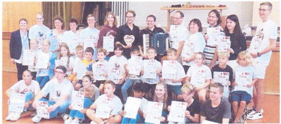
Gruppenfoto der Teilnehmenden des Akkordeonjugendtages des Deutschen Harmonika-Verbandes LV Bayern e.V. 2023 im Sportheim Überacker.

Das Cajon, ein aus Peru stammendes Schlaginstrument mit trommelähnlichem Klang (spanisch »Schublade«